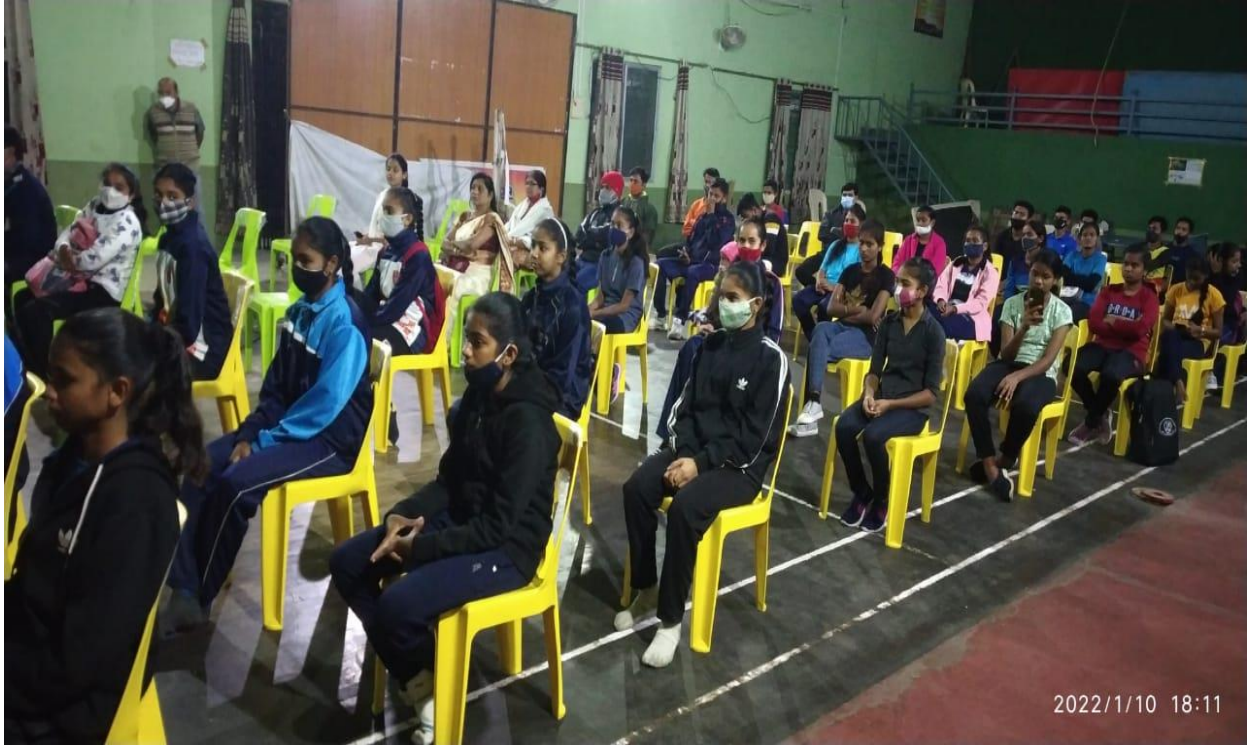
Earn and Learn schem