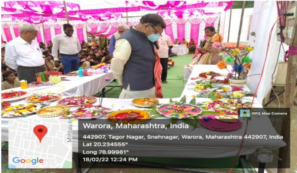
Celebat organise arreng program on